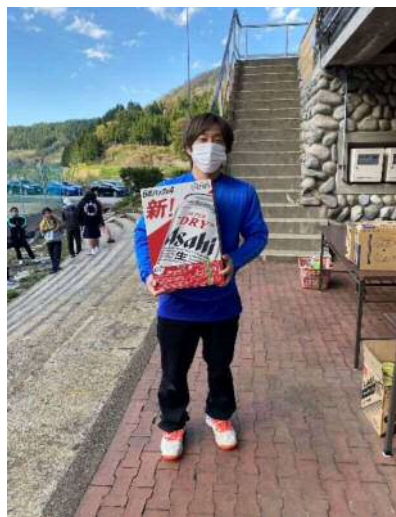
準優勝 トムキヤットA